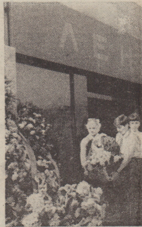
Первые весенние цветы... В эти дни лагают их к памятникам В. И. Ленину. Каждый год пионеры 8-й средней в столицу ярко-красные тюльпаны, участки. В день рождения В. И. Ленинской школы возложили эти цветы к Мавзолею.