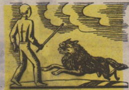
Фото В. ГУСЕВА. Рис. Н. КАРЕВОН

берды. Конечно, настоящие батыры вместе и в беде, и в победе.